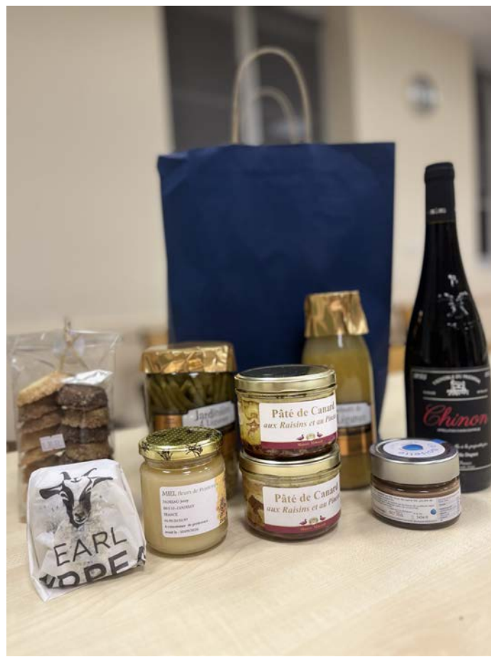
A l'occasion du 11-Novembre, des paniers garnis de produits locaux et de qualité, sélectionnés et confectionnés par les membres du conseil municipal, ont été offerts à nos aînés. Une version comprenant des produits adaptés était offerte aux personnes résidant en Ehpad.