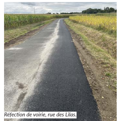
Réfection de voirie, rue des Lilas.

• Les tarifs pour l'assainissement individuel pratiqués par NCA sont les suivants. Contrôle de conception : 176 € ; réalisation : 176 € ; diagnostic : 259,60 €. Ces prestations sont à la charge des usagers.