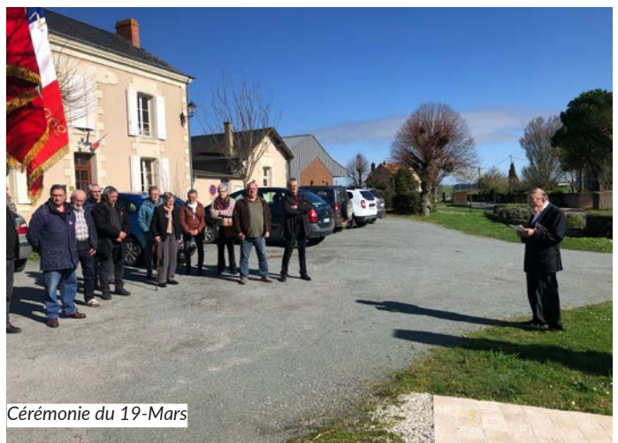
Cérémonie du 19-Mars