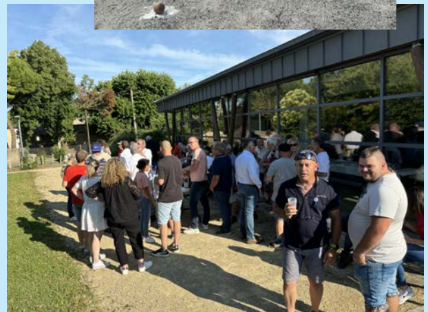
Au programme de la journée du 14 juillet : randonnée avec pause gourmande le matin, cérémonie officielle, concours de boules en bois et casse-croûte en soirée.