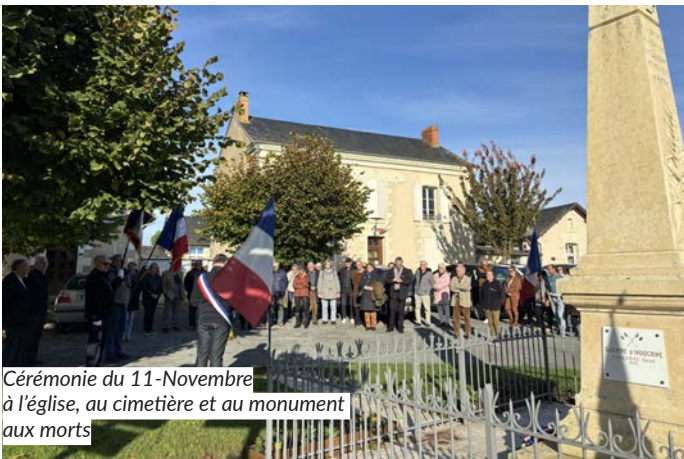
Cérémonie du 11-Novembre à l'église, au cimetière et au monument aux morts