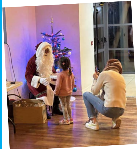
La fête de Noël pour les enfants de Coussay et leur famille était organisée le 6 décembre. Un spectacle, des cadeaux pour les enfants jusqu'à 12 ans, des chocolats et un casse-croûte étaient offerts.