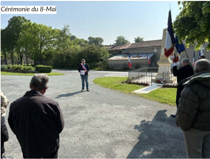
Cérémonie du 8-Mai