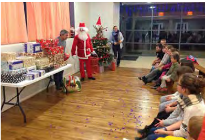
Le père Noël est passé le 9 décembre après le spectacle d'un magicien.