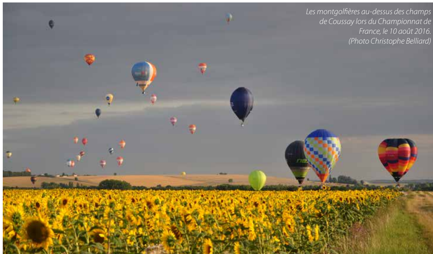
Les montgolfières au-dessus des champs de Coussay lors du Championnat de France, le 10 août 2016.

Informations sur Facebook : Coup de crayon - Mirebeau