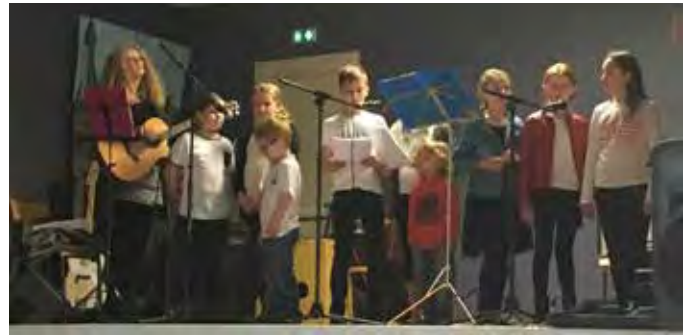
La fête de la musique, le 18 juin, dans la salle des fêtes de Coussay en raison d'une météo incertaine.