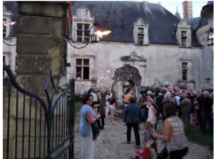
Il y a eu beaucoup de monde lors des visites commentées dans Coussay à la tombée de la nuit cet été (ici, le 16 juillet), organisées par la Communauté de communes du Mirebalais.