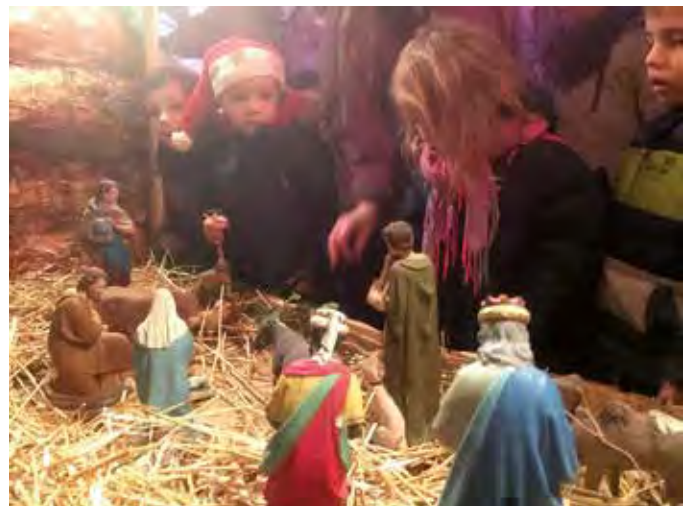
Préparation et installation de la crèche à l'église, le 17 décembre.