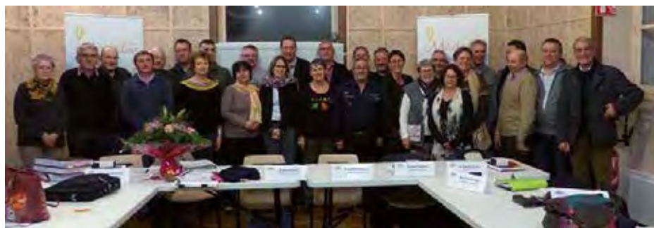
Le dernier conseil communautaire s'est tenu le 15 décembre à Vouzailles.

Certaines de ces compétences gérées par le Mirebalais ne seront pas reprises dans la Communauté de communes du Haut-Poitou. Elles reviendront donc aux communes, et la gestion des budgets qui vont avec.