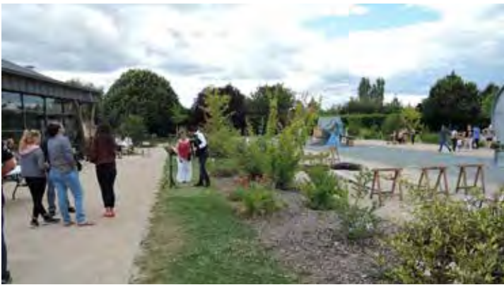
Le 14 juillet en chansons et en jeux.