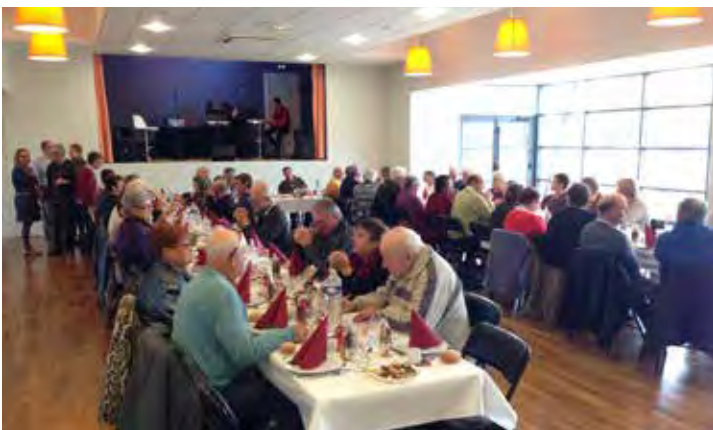
Le repas du 11 novembre, avec une animation par deux chanteurs.