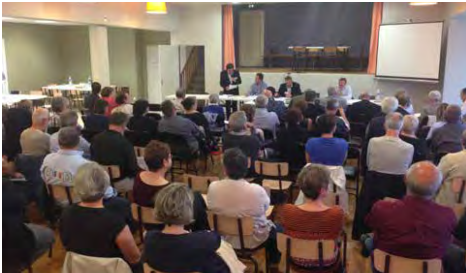
Coussay accueillait, le 6 juin dernier, une réunion de travail des élus des trois Communautés de communes concernant la fusion entre le Mirebalais, le Neuvilleois et le Vouglaisien.

D epuis le 1 er janvier 2017, l'Etat a imposé de réorganiser ce qui avait été patiemment construit avec la Communauté de communes (CdC) du Mirebalais, pour la regrouper avec celles du Neuvilleois et du Vouglaisien.