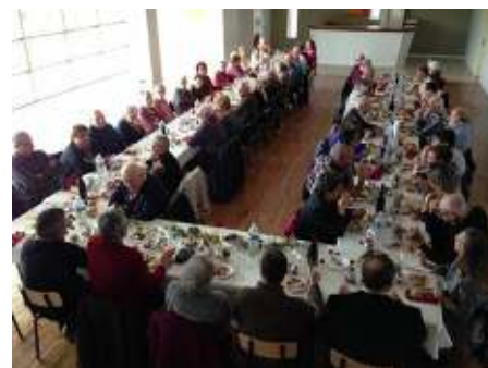
Repas du 11 novembre