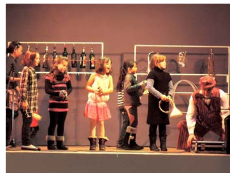
Spectacle de Noël le 13 décembre