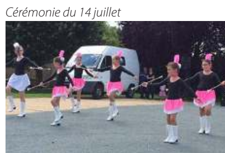
Cérémonie du 14 juillet