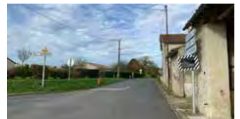
Pose d'un miroir pour sécuriser le croisement entre la D 7 (Coussay - Saires) et la D 20 (direction Verrue) à Brizay.