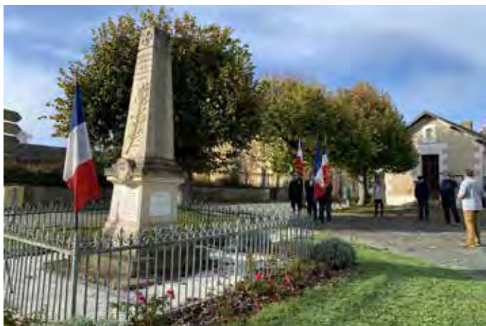
Célébration du 11-Novembre.