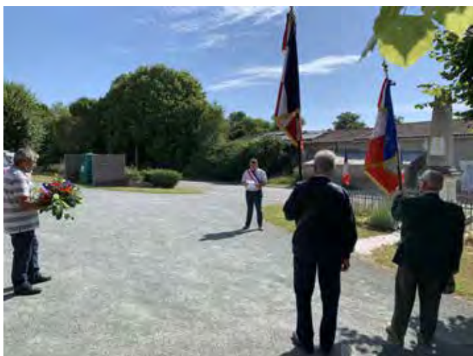
Cérémonie du 14-Juillet.