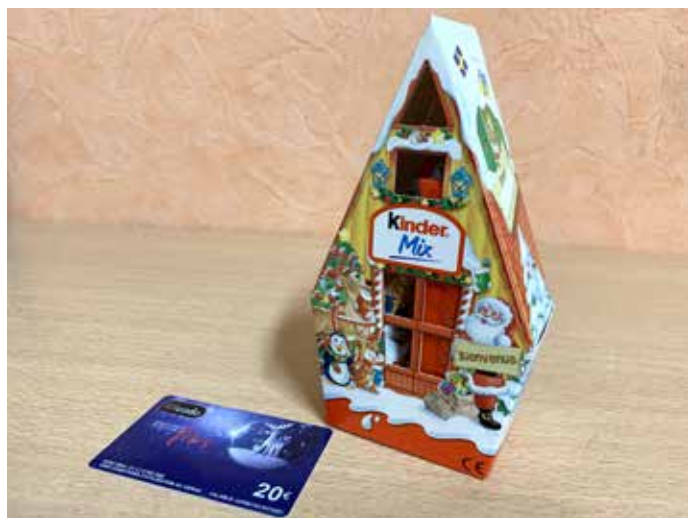
Pas de Père Noël en 2020 à Coussay. Mais les enfants de la commune n'ont pas été oubliés avec une boîte de chocolats et une carte cadeau pour chacun.