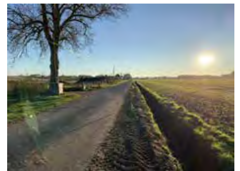
Un programme annuel d'entretien des fossés a été lancé (ici à la Jaulerie).

• La convention d'entretien de l'éclairage public par le Syndicat Energies Vienne est signé.