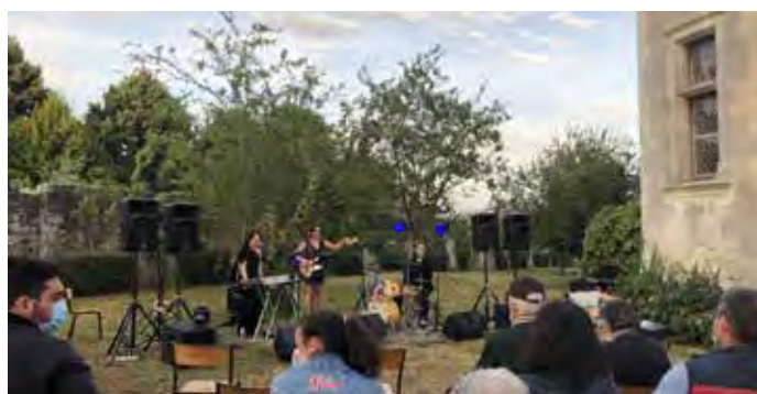
Seule animation de l'été dans la commune : le très bon concert organisé en extérieur par l'office de tourisme du Haut-Poitou au château de Coussay le 1 er août.